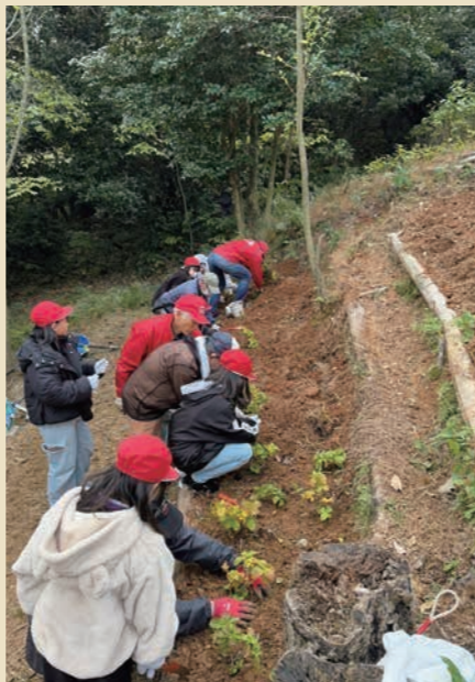
たくさんのボランティアが協力