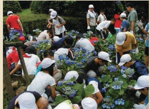
育てた鉢植えを植樹