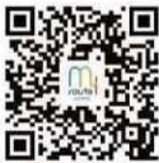
ダウンロードは コチラ