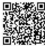
よくある質問は コチラ