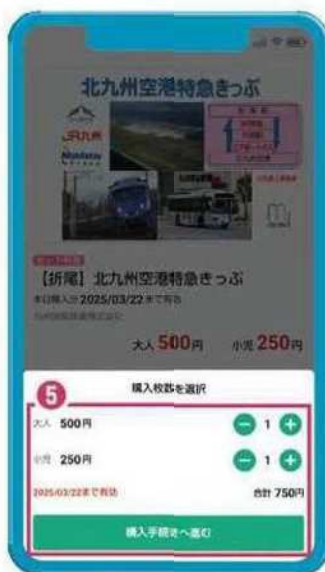
⑤ 枚数を選択し「購入手続き」を完了させる。