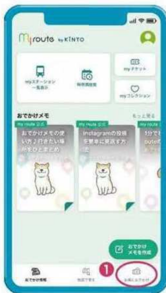
① TOPページの右下「お出かけ」をタップ。