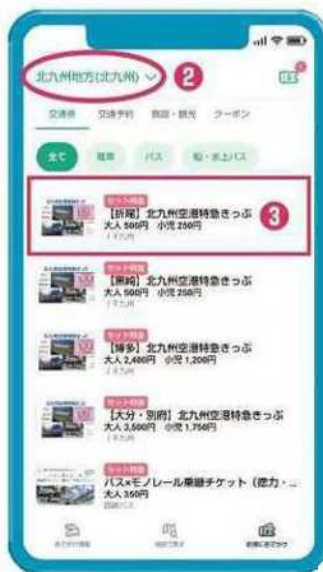
② 「地域」を選択して、 ③ 「使用したいチケット」を選択。