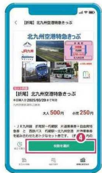
④ 内容を確認して「枚数選択」画面へ。