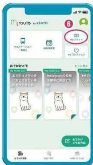
⑥ 購入したチケットはTOPページの右上「myチケット」に格納。