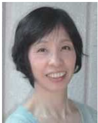
あさの あつこ 児童文学作家