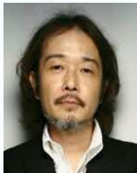
リリー・ فرانキー イラストレーター 作家・俳優など