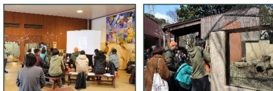
昨年度開催時の様子

スケジュール 11:00 オリエンテーション・講義 11:50 撮影実習 13:40 休憩 14:10 講評・意見交換 14:55 令和 7 年度小倉北区役所公認カメラマン任命式