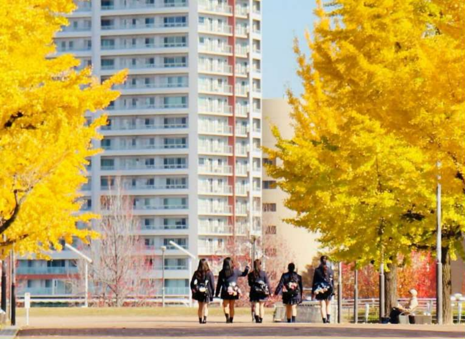
黄金色の イチョウ並木