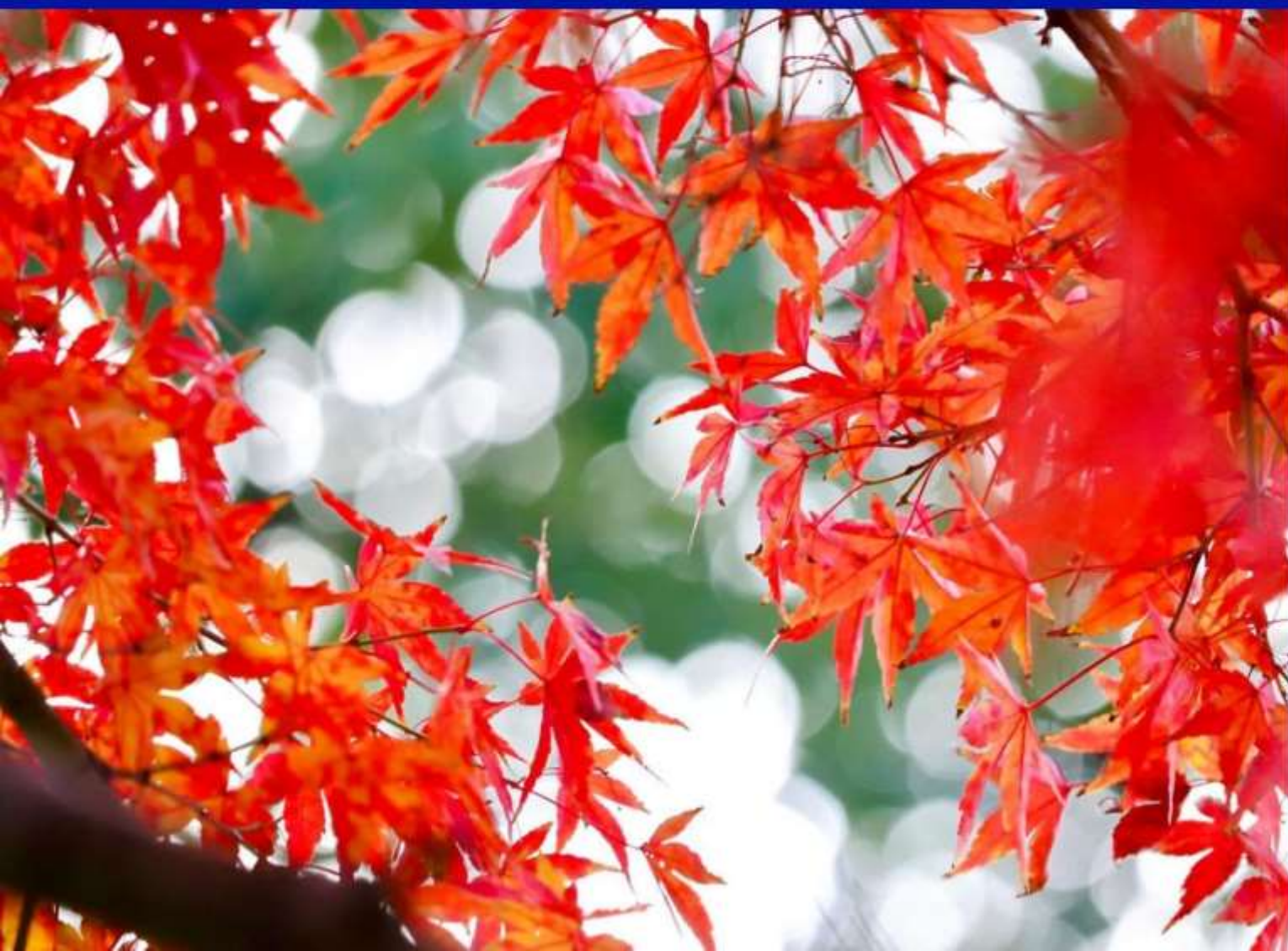
紅く色づくモミジ