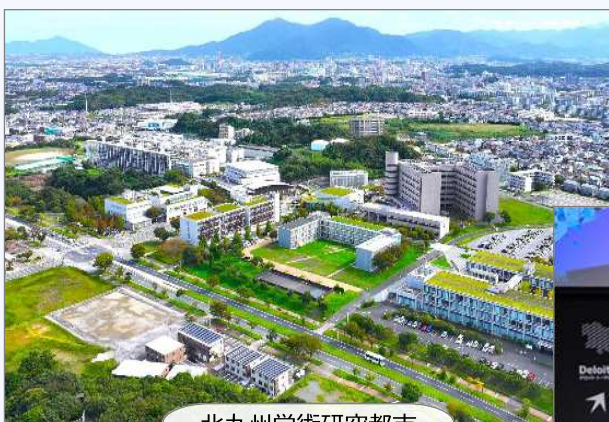
北九州学術研究都市