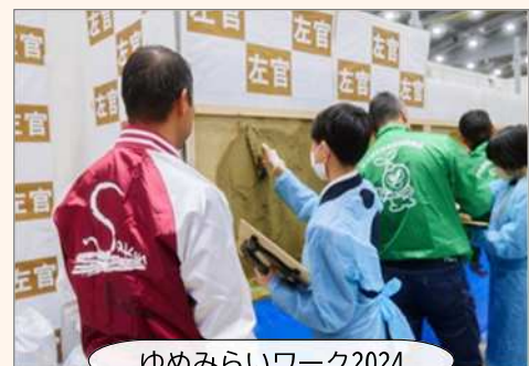
ゆめみらいワーク2024