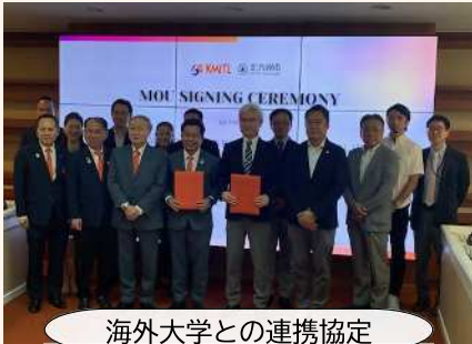
海外大学との連携協定