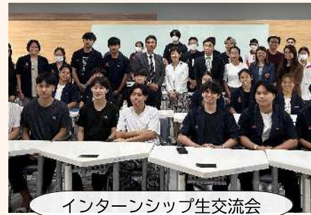
インターンシップ生交流会