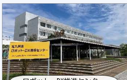
ロボット・DX推進センター