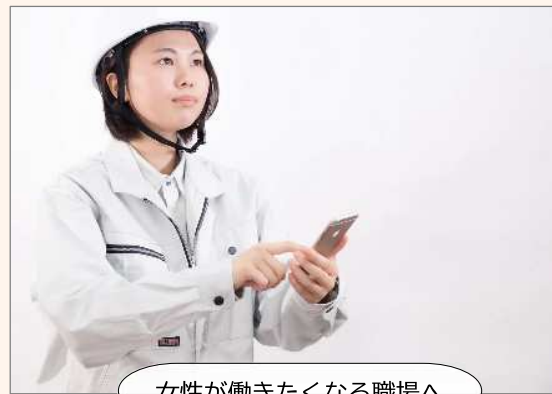
女性が働きたくなる職場へ