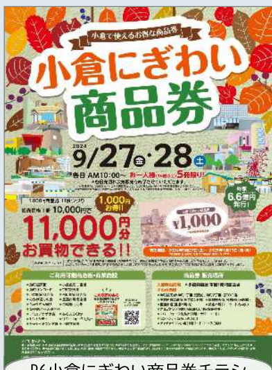
R6小倉にぎわい商品券チラシ