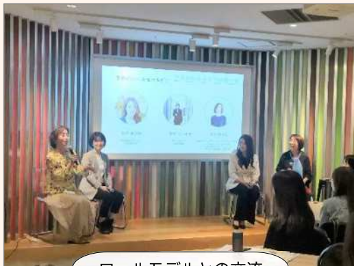
ロールモデルとの交流