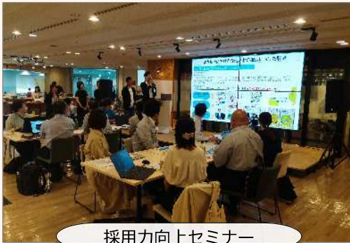
採用力向上セミナー