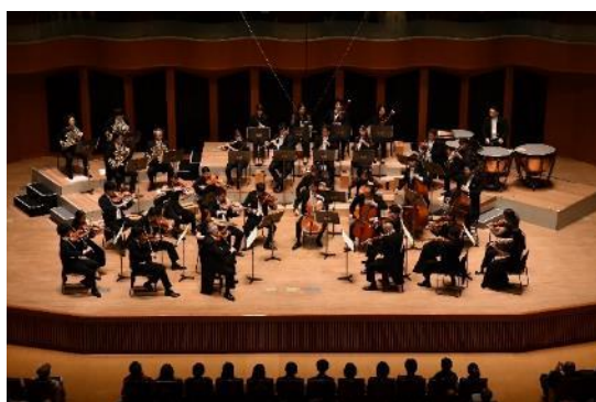
北九州国際音楽祭

なお、発信力の強化にあたり、海外、全国、近隣地域など、ターゲットを意識した情報発信に努めます。