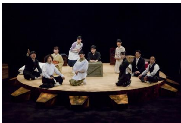
北九州芸術劇場＋市民共同創作劇 「君といつまでも～Re:北九州の記憶～」