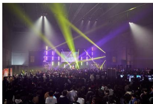
北九州ポップカルチャーフェスティバル