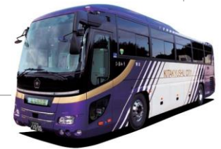
観光バス「ひまわり」