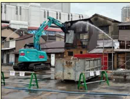
10/28 解体着手時の様子