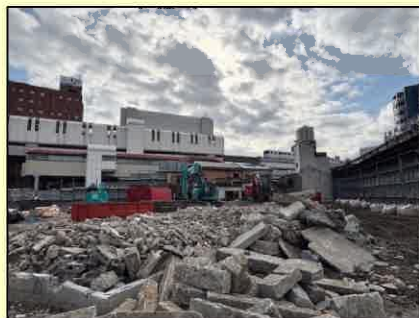
12/9 時点の現場の様子 (がれきの仕分け作業)