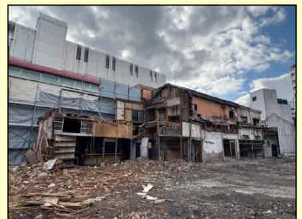
モノレール側建屋の様子 (年内に解体完了予定)