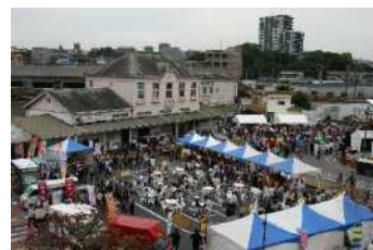
「ありがとう折尾駅舎」イベントの様子