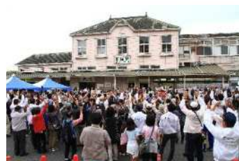
「ありがとう折尾駅舎」イベントの様子