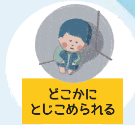
どこかに とじこめられる