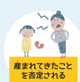
産まれてきたこと を否定される