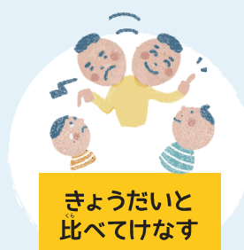
きょうだいと 比べてけなす