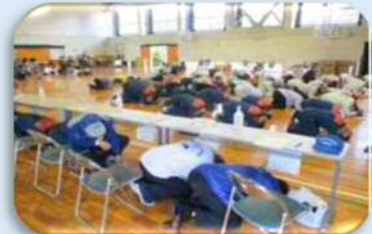
地震発生時の 初動対応訓練