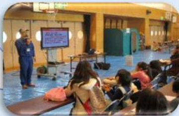
能登半島地震 派遣職員の話