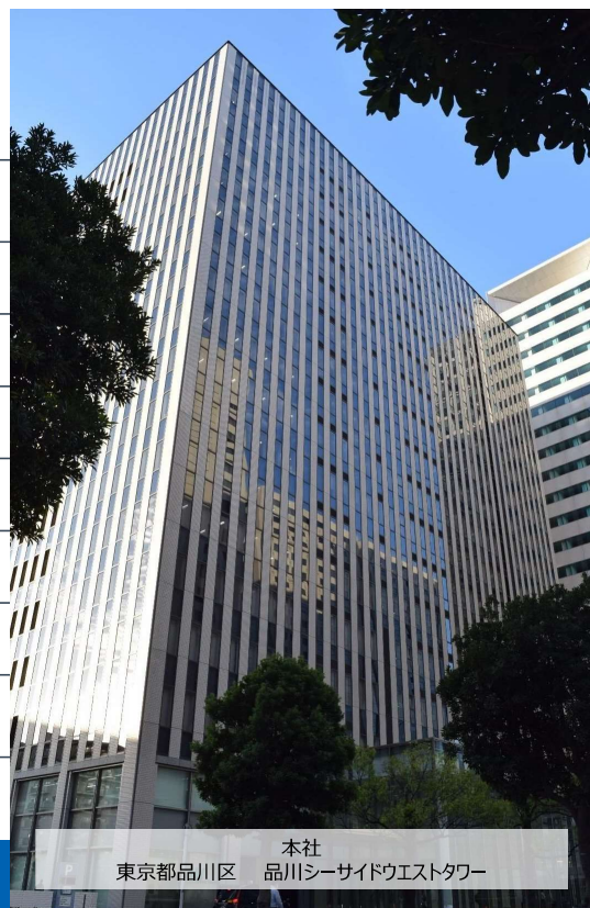
本社 東京都品川区 品川シーサイドウエストタワー

Copyright © Mitsubishi Research Institute DCS Co.,Ltd.