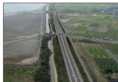
（完成イメージ）曾根東臨海スポーツ公園交差点付近