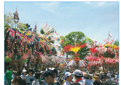
曾根の神幸行事の人形飾山

https://www.city.kitakyushu.lg.jp/kokuraminami/file_0100.html