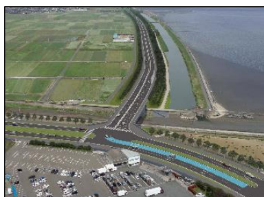
（完成イメージ）朽網北交差点付近