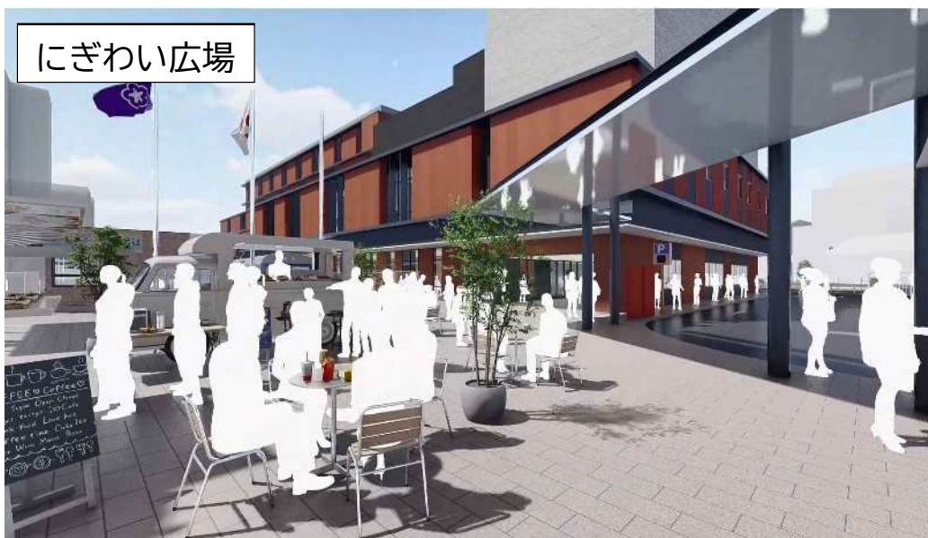
(図) 完成イメージパース