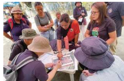
ダバオ市で廃棄物管理の指導をしている様子

近年、アジア地域の経済成長は著しく、環境分野への投資資金の流入はますます加速してきています。北九州市は、アジア地域での環境国際協力によって築き上げたネットワークを活かして、市内企業の海外ビジネス展開をさらに支援していきます。