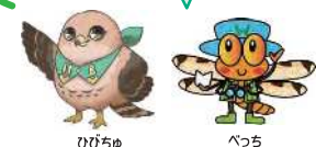
響灘ビオトープ公式マスコットキャラクター