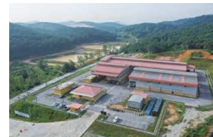
マレーシアの循環資源製造所の様子