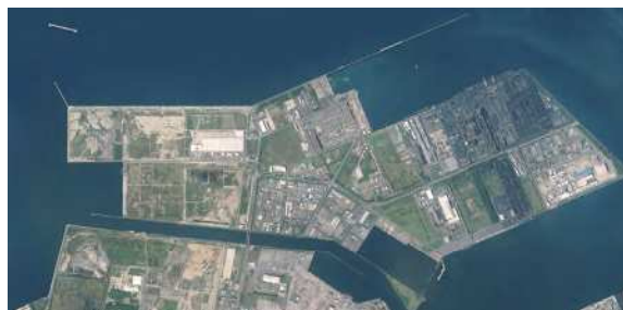
響灘地区のエコタウン

また、エコタウンの視察者は、年間約10万人にのぼり、平成13(2001)年設立された「北九州エコタウンセンター」を拠点に、環境学習フィールドとしても活用されています。