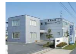
福岡大学資源循環・環境制御システム研究所(産学官連携研究機関)

ています。その一つが蓄電池のリサイクルシステム構築です。北部九州には自動車の製造拠点が集積しています。電気自動車が普及する将来を見据えると、リサイクル産業の集積地である北九州市は、蓄電池リサイクルの拠点として大きなポテンシャルを持っています。