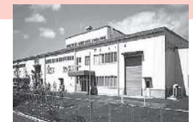
西日本ペットボトルリサイクル株式会社

近年、将来的な資源制約や環境問題等を背景に、世界では“大量生産、大量消費、大量廃棄”から、“資源の効率的・循環的な利用の重要性”が叫ばれています。北九州市においても、“ゼロからモノをつくる企業”と“廃棄物を再資源化する企業”の連携は事業を持続させる新たな成長エンジンであり、次世代を担う新たな環境産業の重要なテーマとなっ