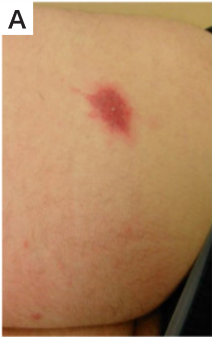
図 2-1 エムポックスの皮疹