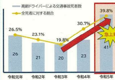
【高齢ドライバーによる交通事故死者数】 (福岡県:令和元年から令和5年までの間)

※「高齢ドライバーによる交通事故」とは、65歳以上の高齢ドライバーが加害者となった交通事故をいう。