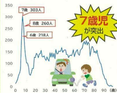
【歩行中の交通事故死傷者数(年齢別)】 (福岡県:令和元年から令和5年までの間)