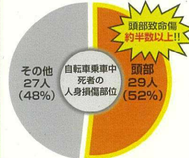
【自転車乗車中死者の人身損傷部位】 (福岡県:令和元年から令和5年までの間)