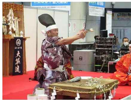
前回の様子(左は氷の彫刻、右は包丁式)