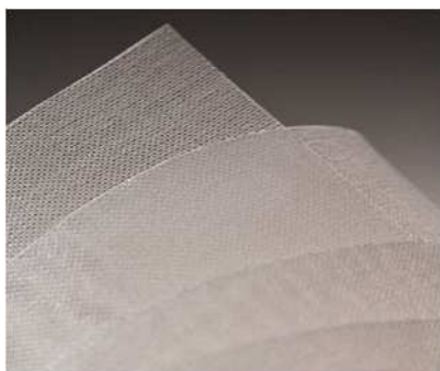
FORBLUE™ Sシリーズの製品写真

AGC（AGC株式会社、本社：東京、社長：平井良典）は、このたび北九州事業所（北九州市戸畑区）において、グリーン水素 *1 製造に適したフッ素系イオン交換膜FORBLUE™ Sシリーズの製造設備新設を決定しました。投資金額は約150億円、稼働開始は2026年6月を予定しており、さらなる能力増強を経て、2030年度に売上高約300億円を目指します。なお、本プラント新設は、2002年に重曹生産を中止して以来、北九州市で24年振りとなる化学品プラント操業にあたり、千葉工場、鹿島工場に次ぐ第三の国内化学品拠点としての再スタートとなります。