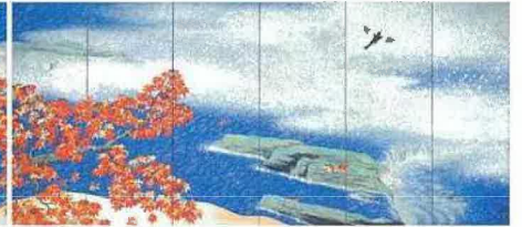
※すべて足立美術館所蔵