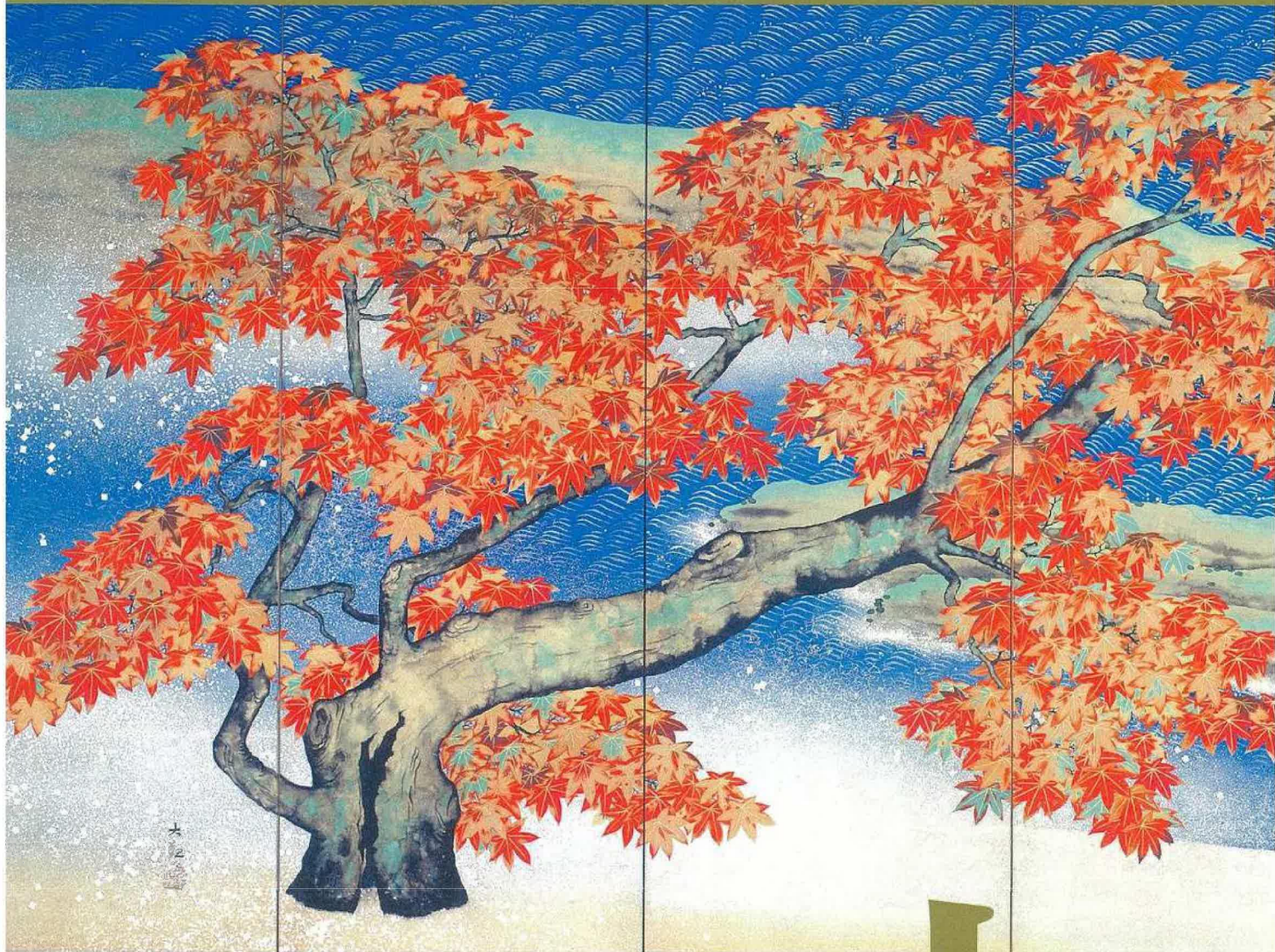
横山大観(紅葉)(左隻-部分) 1931(昭和6)年 足立美術館蔵