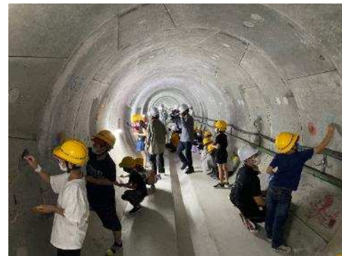
小学校現場見学会の様子