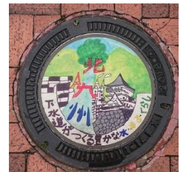
デザインマンホールの例