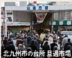
北九州市の台所 巨過市場