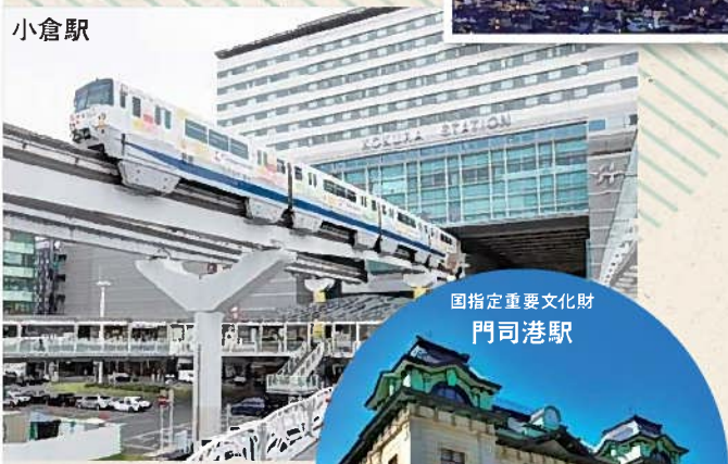
国指定重要文化財 門司港駅