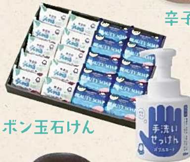
シャボン玉石けん