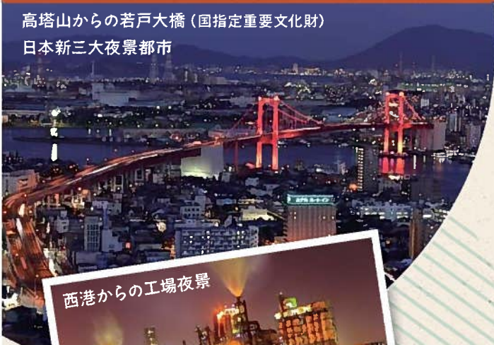
西港からの工場夜景