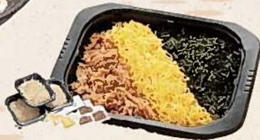
東筑軒 冷凍かしわめし