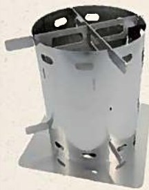
巻き薪ストーブ コンパクト