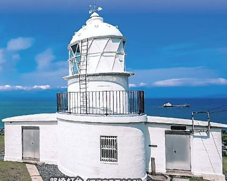
部埼灯台（国指定重要文化財）

慶應3（1867）年、幕府が兵庫開港に備えて英国公使と約定した5灯台の一つ。明治5年に初点灯し、百数十年を経て海の難所に光を投げかけ続けています。