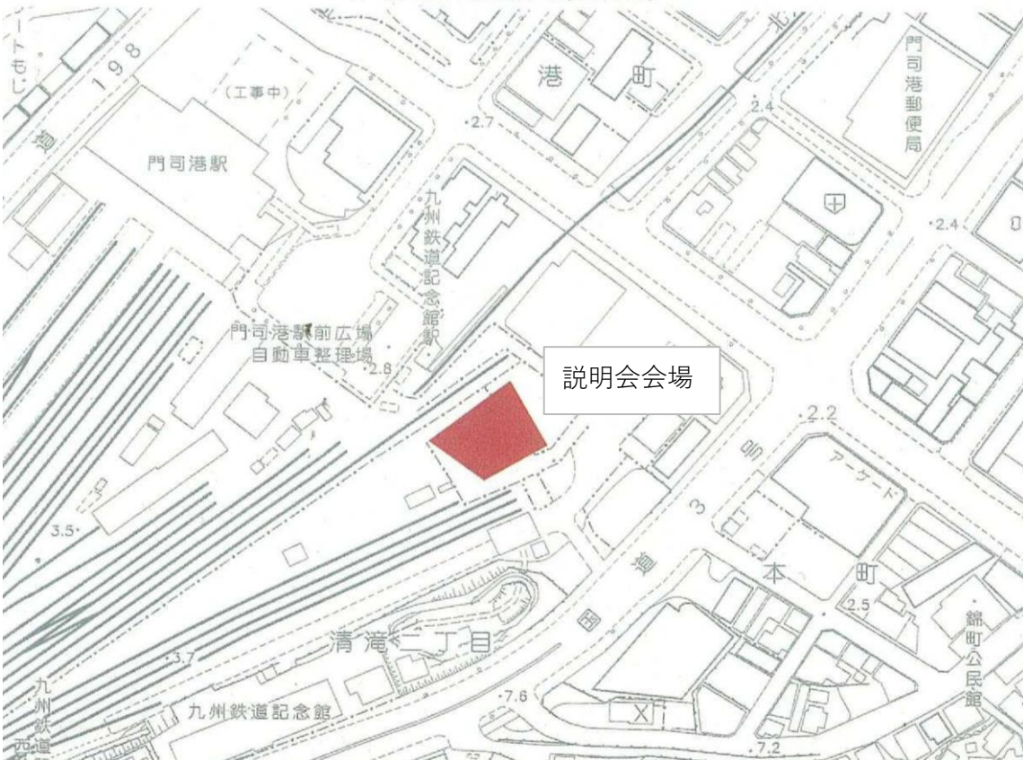
第2図 説明会会場詳細図