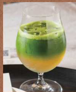
勝負ドリンクに選ばれた「茶論ジンジャーエール」も楽しめる

2023年10月、将棋の最高棋戦・第36期竜王戦七番勝負第3局北九州対局で、対局会場となった大座敷棟。1896年(明治29年)に、官営八幡製鉄所の誘致に向けた初会合が開かれた場所であり、中国の革命家・孫文も訪れたことがある。1912年(同45年)、若松区にあった敬一郎氏宅から現在地へと移築された。