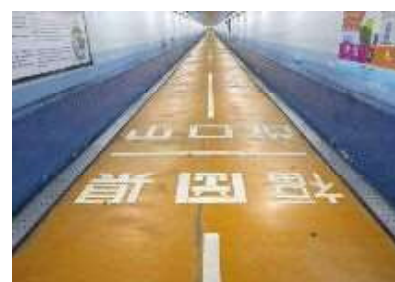
関門トンネル人道