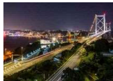
和布刈公園第二展望台からの夜景