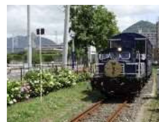
北九州銀行レトロライン潮風号