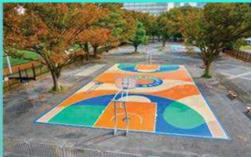
参考：代々木公園 バスケットコート https://prtimes.jp/main/html/rd/p/000000010.000090103.html