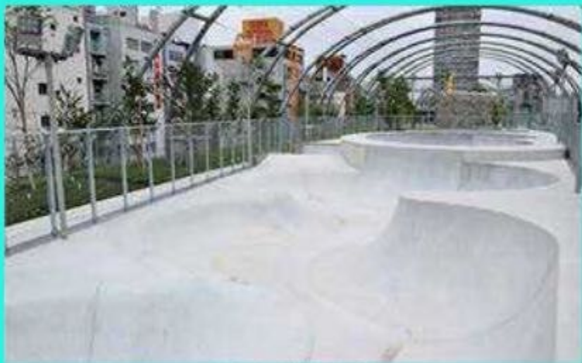
参考：宮下公園 施設紹介 https://www.seibu-la.co.jp/park/eniyashita-park/facility/