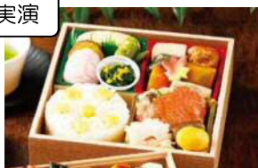
〈美濃吉〉 京の味わい（栗ご飯）