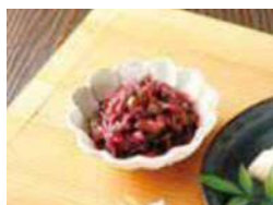
〈川勝總本家〉 樽出し しば祇園赤しそ