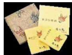
〈左り馬〉身だしなみセット

京都の工芸品は、伝統を守りながらも柔軟に変化し続ける職人の匠の技に裏打ちされた現代にもマッチする逸品揃いです。