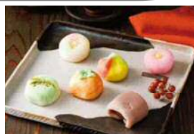
〈俵屋吉富〉 季節の上生菓子6種