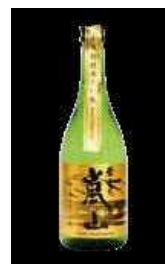
〈丹山酒造〉 純米大吟醸 嵐山