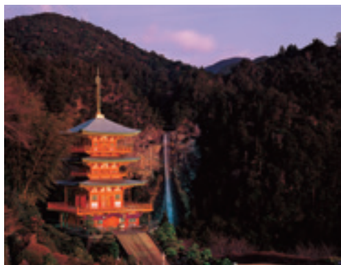
青岸渡寺三重塔と那智大滝 1994年

本展を通して、「日本の世界文化遺産」を未来へと継承する意義を見出していただければ幸いです。