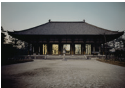
唐招提寺金堂 1968年頃