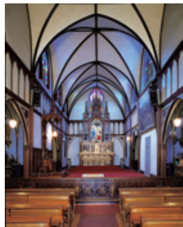
大浦天主堂内部 1989年