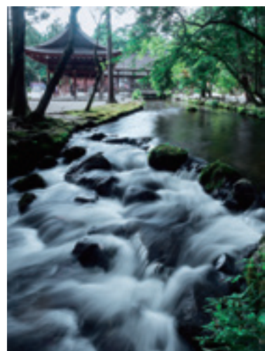
上賀茂神社 ならの小川 2014年