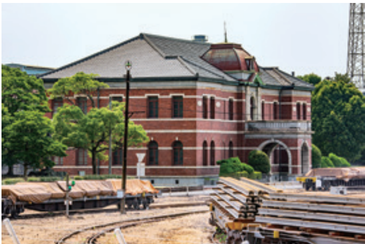
官営八幡製鐵所 2015年

しかし八幡にいれば何とか暮らせるのだ。八幡製鐵所があった、その下にまた別の下請け会社の働き口があって、町がある。八幡の活気を頼って西日本一帯から続々と人が集まる。 村田喜代子『八幡炎災記』(平凡社、二〇一五年二月)より