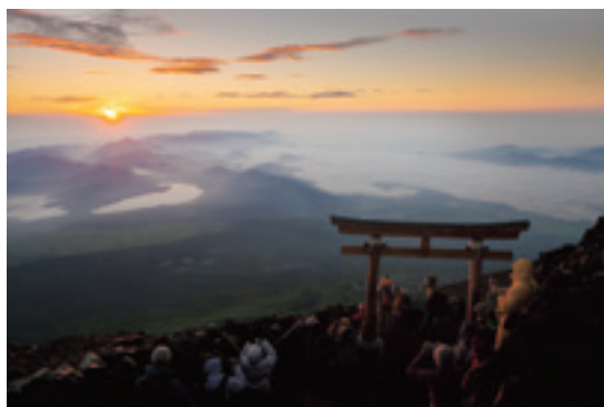
富士山頂から御来光を見る登山者 2013年