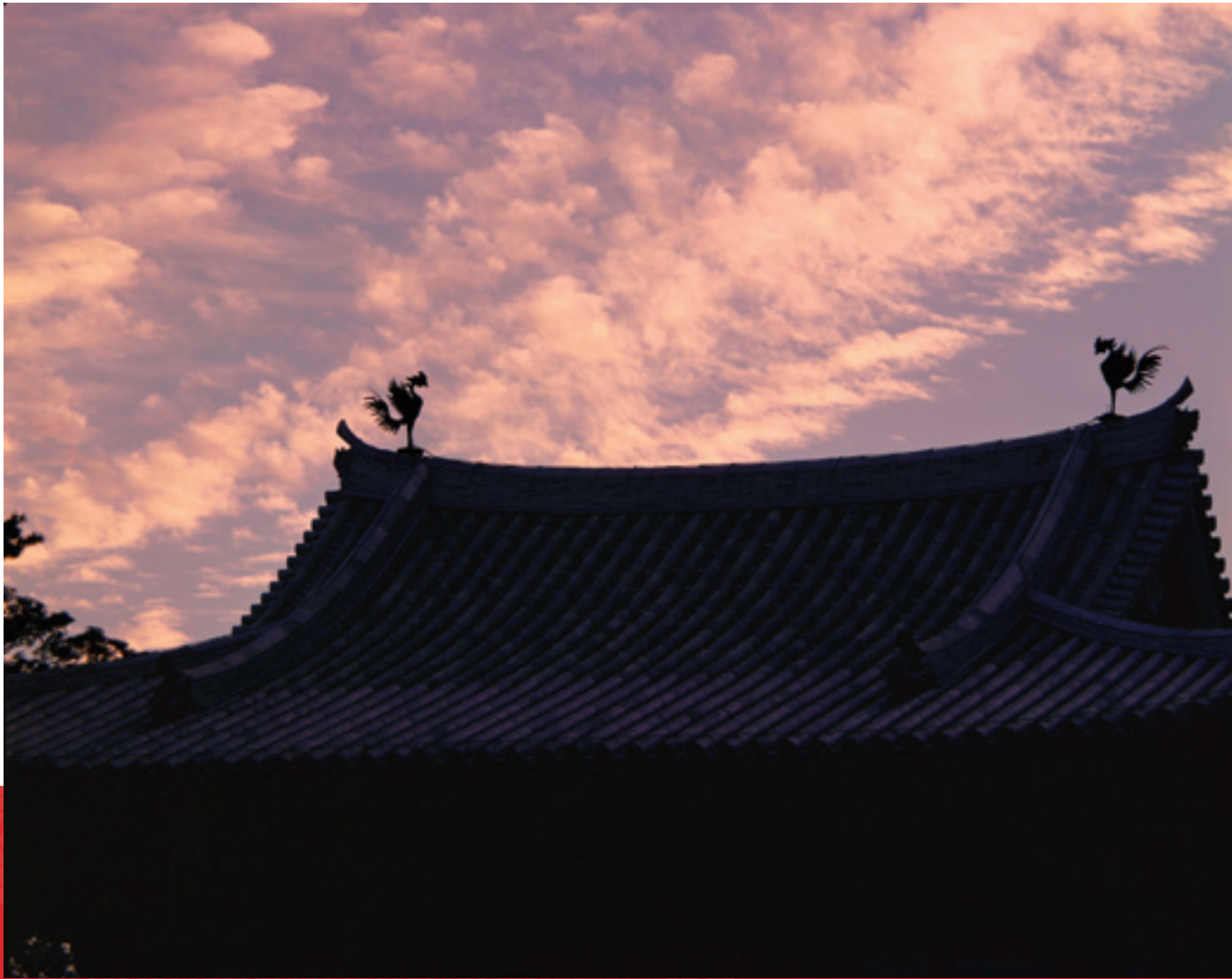
平等院鳳凰堂夕焼け 1961年