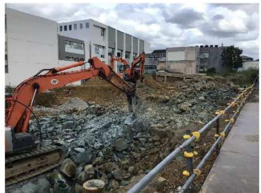
管理教室棟2 : 岩の破碎作業

※基礎地中梁 : 建物の基礎部分を支えるため、地中に埋められた基礎相互間をつなぐ梁。