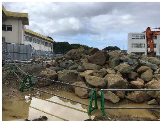
管理教室棟2 : 地中にあった岩