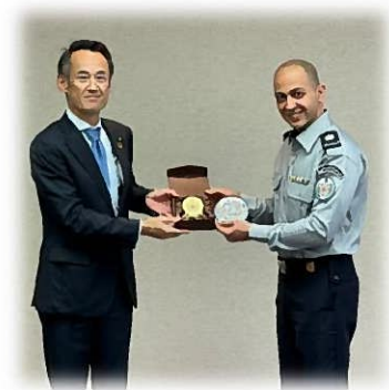
写真：令和4年度稲原副市長表敬