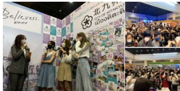
「バンコク日本博」で北九州市 PR ブースを設置