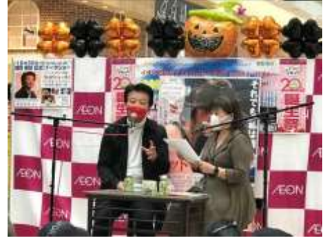
イオン若松ショッピングセンターでのトークイベント