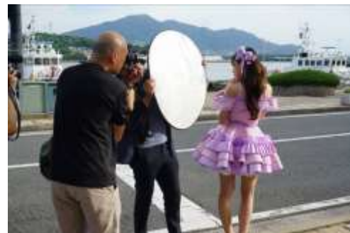
ミュージックビデオ撮影の様子