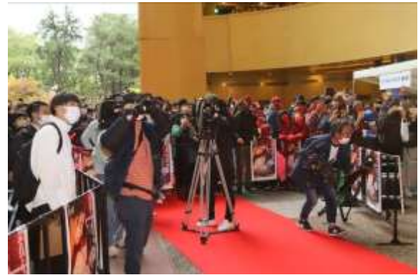
リバーウォーク北九州でのレッドカーペットイベント