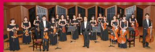
響ホール室内合奏団 公式Facebookページ、Instagramもご覧下さい

北九州市の音楽専用ホール・響ホールの初代館長、故後藤忠雄の発案により、「響ホール室内合奏団」という名称で1998年に結成された。2003年からは、ミュージック・アドバイザーに、前東京藝術大学学長である澤和樹氏が就任している。1998年より年2回の定期演奏会を行うほか、スクールコンサートなど様々な依頼演奏会や2012年より市民の皆様から演奏会場を募り、音つむぎコンサート(無料出張コンサート)を年間約10か所で行っている。「0才からの音楽会」や合奏団オリジナルダイジェスト版のオペレッタなどバラエティに富んだ活動が続いている。2度の英国公演、韓国国際音楽祭への招聘、韓国ソウル青砥センター室内楽ホールのこけら落とし公演に出演するなど、海外公演も多く行っている。2008年には創立10周年を記念し北九州市、和歌山市、東京都(紀尾井ホール)にて公演。2013年北九州市制50周年を記念式典にて演奏、浜松市のアンサンブル・ミュージック弦楽合奏団と交流演奏。2016年G7北九州エネルギー大臣会合歓迎レセプションにて演奏。同年北九州で2団体目となる認定NPO法人を取得。2017年 第30回定期演奏会においては、東京藝術大学大学院映像研究科とのヴィヴァルディの「四季」の演奏を行い、気鋭のアニメーターによるオリジナルアニメーションは、世界初演となる“AIによる音楽と映像のコラボレーション”として注目を浴びた。東アジア文化都市2020▶2021開幕式典文化交流や北九州空港全面協力により日本航空社、スターフライヤー社とコラボレーションが実現し、北九州市を国内外にアピールするシーンでの演奏に積極的に参加している。コロナ禍においては、感染予防を徹底しながらの公演を続け、ライブ配信を行うなど北九州から全国・海外へ向けて音楽を発信している。2022年には2度目となる東京公演を行い、音楽専門誌より高く評価される。2023年6月に行われた「みどりの愛護」の集い開催記念交流会において秋篠宮殿下の御前にて演奏。創立25周年を記念して福岡公演を開催予定。