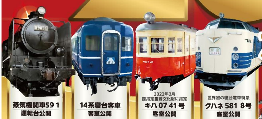
蒸気機関車59 1 運転台公開 14系複台客車 客室公開 2022年3月 国指定重要文化財に指定 キハ07 41号 客室公開 世界初の複台電車特急 クハネ581 8号 客室公開

29日 30日 開館 開館 展示車両運転室・客室公開 公開時間 29日 9:00~16:00 30日 11:00~16:00