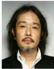
リリー・フランキー イラストレーター 作家・俳優など