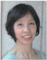
あさの あつこ 児童文学作家