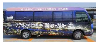
皿倉山ケーブルカーシャトルバス