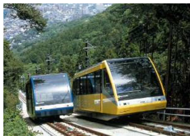
皿倉山ケーブルカー