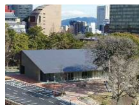
平和のまちミュージアム