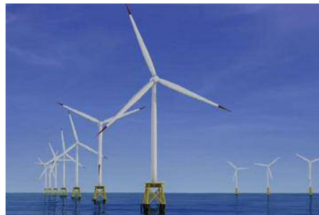
響灘の洋上ウインドファームイメージ図 (グリーンエネルギーポート事業紹介動画より)