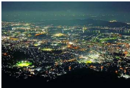
皿倉山からの夜景

このような北九州市の歴史や文化、産業など、暮らす人が育んだ魅力が、訪れた人との交流するきっかけ作り、にぎわいや活気、新しい文化を生み出す原動力となり、都市の発展につながっていきます。