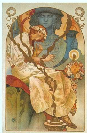
<スラヴ叙事詩展> 1928年