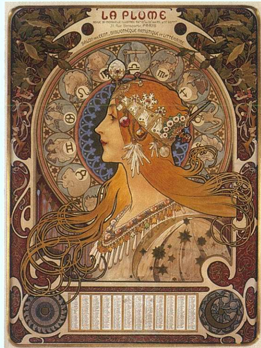
<黄道十二宮 ラ・ブリュム誌のカレンダー> 1896年

本展ではミュシャ作品の世界的収集家として知られる尾形寿行氏のコレクションからポスター、装飾パネルをはじめ、デザイン集、ポストカード、切手、紙幣、商品パッケージなど約500点を展示、その生涯に迫ります。