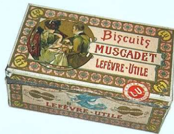
<ルフェーヴル・ユティル社のビスケット缶容器> 1901年