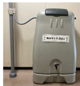
※雨水タンクイメージ

助成対象者 雨水タンク設置に関する建物の所有者または使用者 助成対象 密閉構造・既製品の雨水タンク(容量100ℓ以上) 助成内容 雨水タンク購入金額の2/3(上限20,000円)