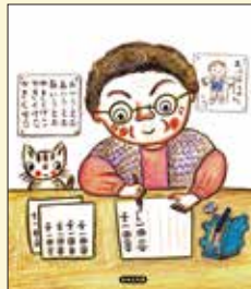
「ひらがなにっき」文・若への絵本制作実行委員会 2008 解放出版社