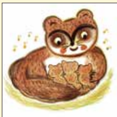
「げんこつやまのたぬきさん」2019 のら書店