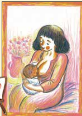
「おかあさんがおかあさんになった日」1993 童心社