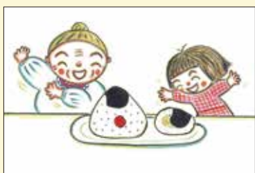
「おにぎりおにぎり」2022 おむすび舎