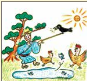
「いちわのからす」2021 福音館書店