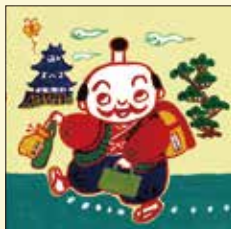
「とのさま1ねんせい」文・本田カヨ子 2017 あすなろ書房