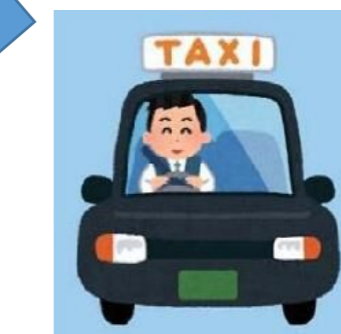
運行：(株)ほほえみ (三ヶ森タクシー)