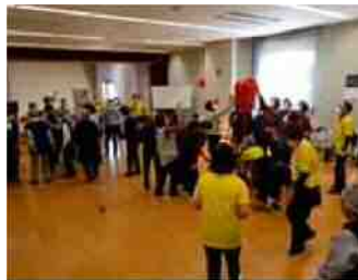
サロン活動の様子(運動会)

またシルバーひまわりサービスの実施、地域のボランティア活動の支援等を行っています。