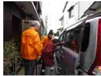
シルバーひまわりサービス