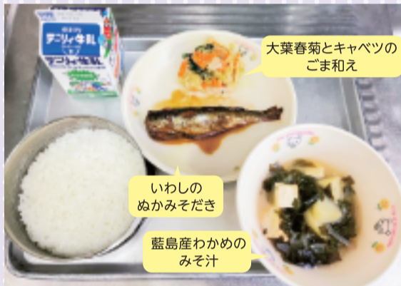
(市制60周年記念献立 北九州市の郷土料理)

このアンケート結果などを踏まえて、今まで以上に満足度の高い、おいしい給食を提供できるよう献立の改善等に取り組んでいきます。