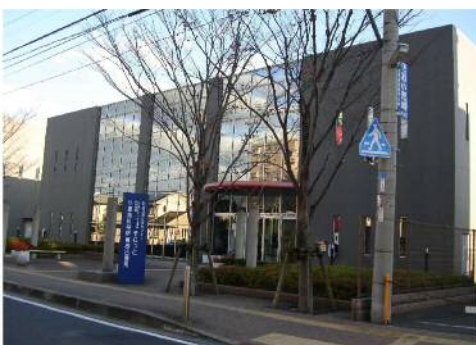
曽根分館(そねっと)