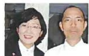
(有)ゼムケンサービス(建設業)