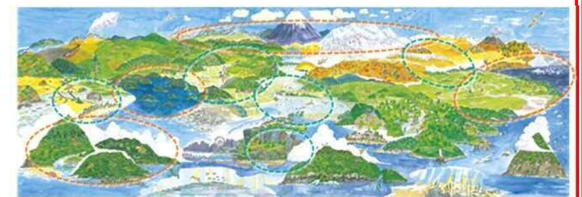
保護地域（オレンジ）とOECM（みどり）でつながる国土の健全な生態系のイメージ