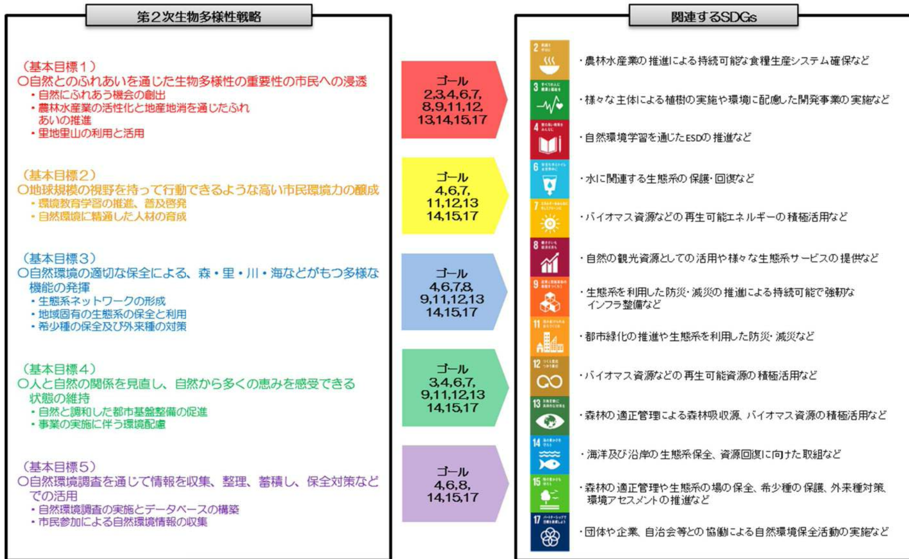
(図) 生物多様性戦略と環境基本計画、SDGs について