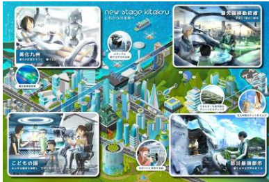
未来予想図を制作 (R1)