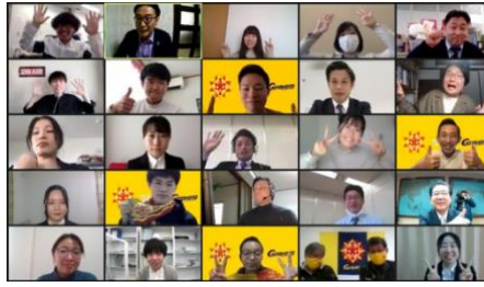
政策アイデア発表会 (R2)