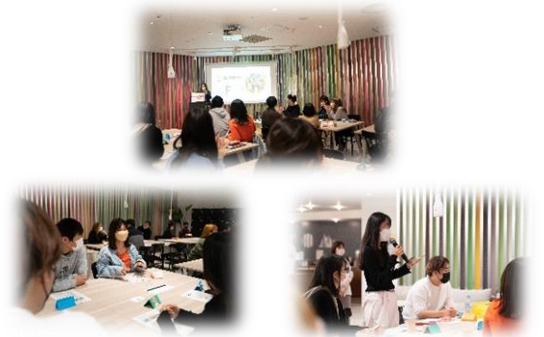
ワークショップのイメージ