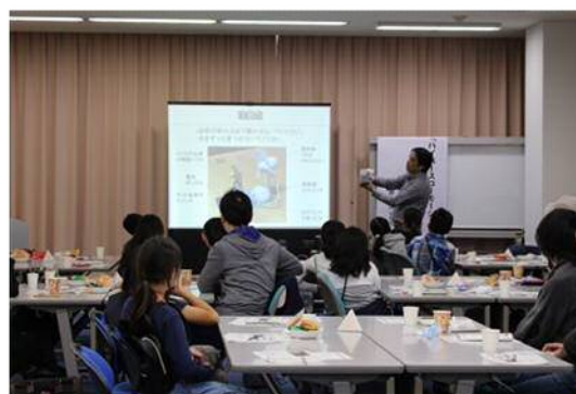
「サイエンスカフェ」