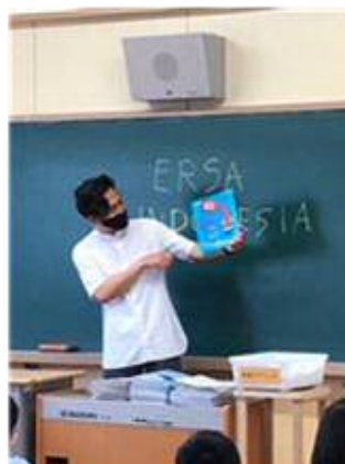
「小学校との交流事業」