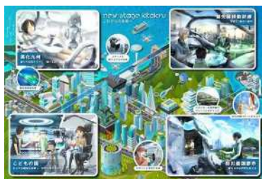
未来予想図を制作 (R1)