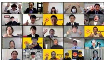
政策アイデア発表会 (R2)