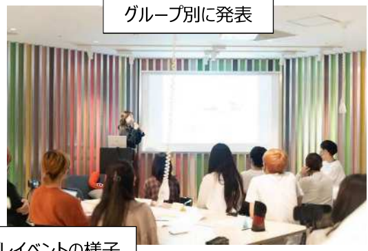
グループ別に発表